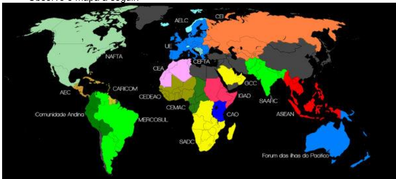
Mapa com a maior parte dos blocos econômicos do mundo